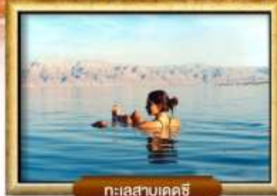
ทะเลสาบเดดซี