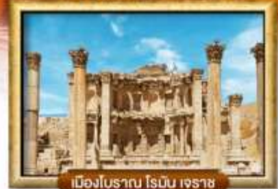
เมืองไบริวาน ไรมัน เจริษ