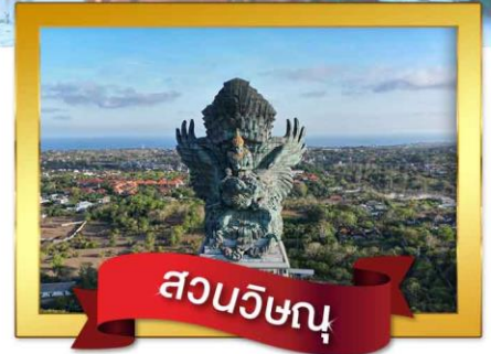
สวนวิษณุ