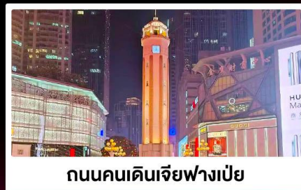
ถนนคนเดินเจียฟางเป่ย์