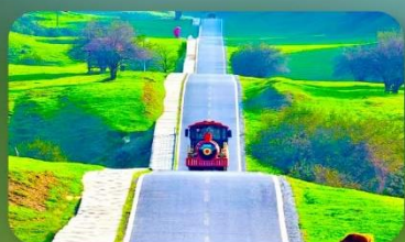
เขานางฟ้า