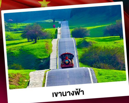
เขานางฟ้า