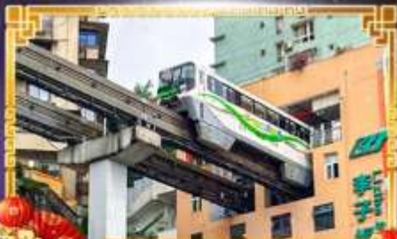
รถไฟฟ้า-ลู่ตีก