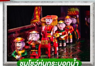
ชมโชว์หุ่นกระบอกน้ำ