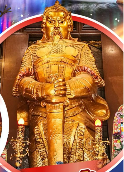
วัดเขกงหมิว