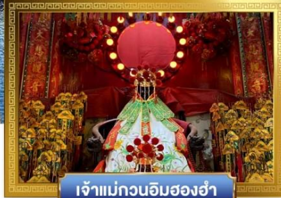
เจ้าแม่กวนอิมสองห้า