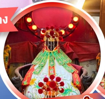
เจ้าแม่กวนอิมสองฮา

ขอพรเสริมความเฮงความบั่ง ยืมเงินเจ้าแม่กวนอิมสองฮา