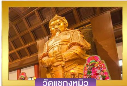
วัดแซงกหมิว