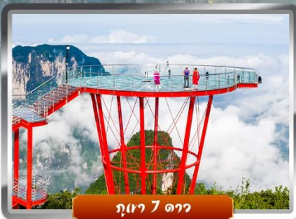
ภูเขา 7 ดาว

✓ ชมหมู่บ้านริมน้ำตก "เมืองโบราณฟูหลงเจิน"