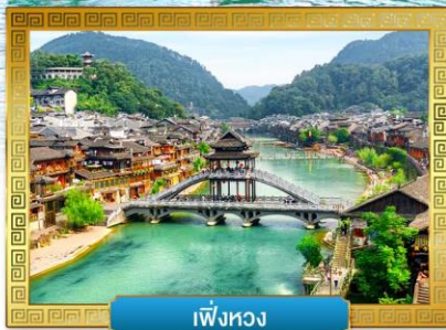
เฟิ่งหวง