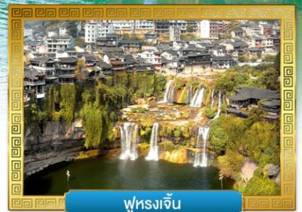
ฟูหยงเจิน