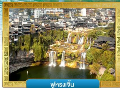
ฟูหยงเจิน