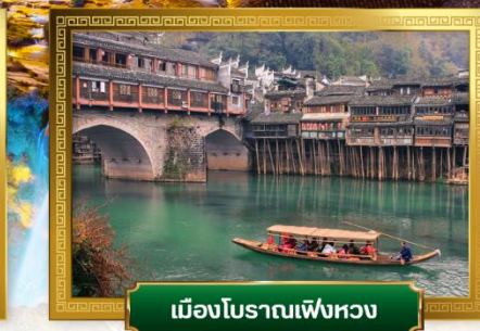
เมืองโบราณเฟิ่งหวง