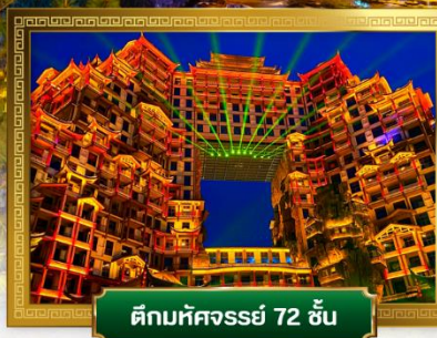
ตึกมหัศจรรย์ 72 ชั้น