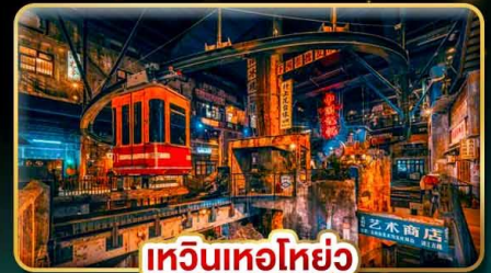
เหวินเหอโฮ่ย