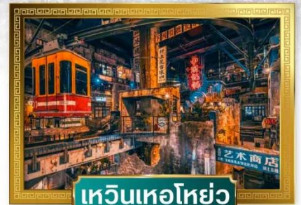
เหวินเหอโฮ่ย