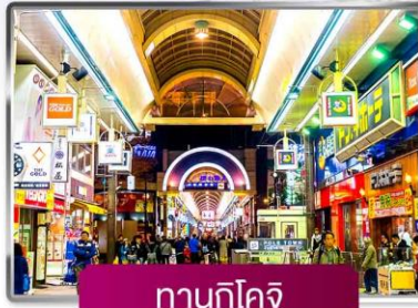
กานุกิโคจิ