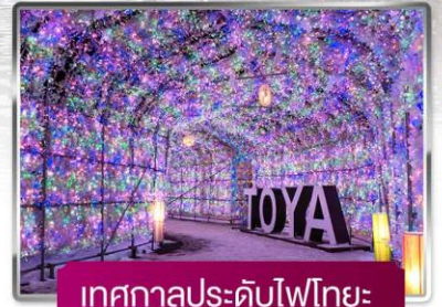
เทศกาลประดับไฟไทยะ