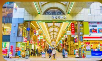
ซัปโปโระนาทูกิโคจิ