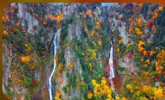
น้ำตกกิงกะ และน้ำตกริวเซ