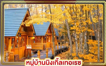
หมู่บ้านนิงเกิ้ลทอเรซ