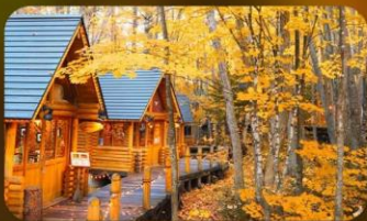
หมู่บ้านนิงเกิ้ลทอเรซ

SAPPORO TOKYU REI หรือเทียบเท่ามาตรฐานญี่ปุ่น