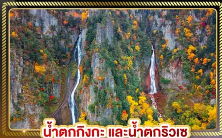
น้ำตกทิงกะ และน้ำตกริวเซ