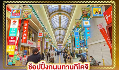
ช้อปปิ้งถนนทานุกิโคจิ