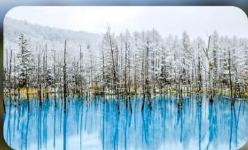
บ่อน้ำสีฟ้า