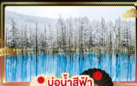
บ่อน้ำสีฟ้า

สัมผัส ซากุระและฤดู และหิมะท้ายฤดูแห่งปี สีสันแห่งชีวิตชีวา