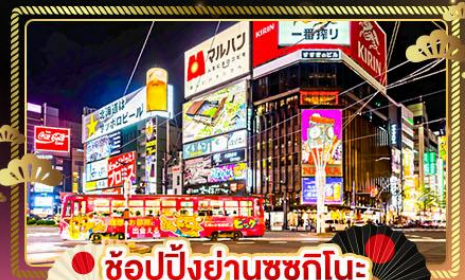
ช้อปปิ้งย่านซุกุชิโนะ