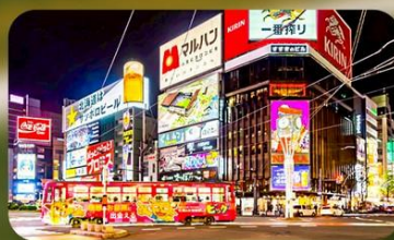
ซูปป์ิงย่านซูซุกิโนะ