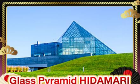
Glass Pyramid HIDAMARI