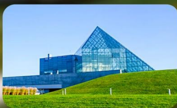
Glass Pyramid HIDAMARI