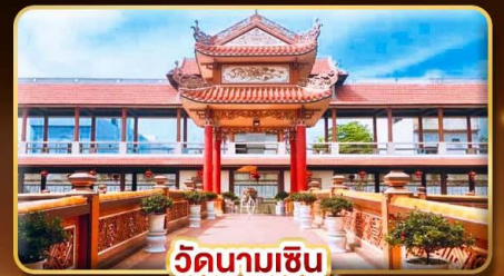
วัดนามเชิน