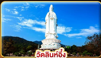
วัดลินห์ฮิ่ง