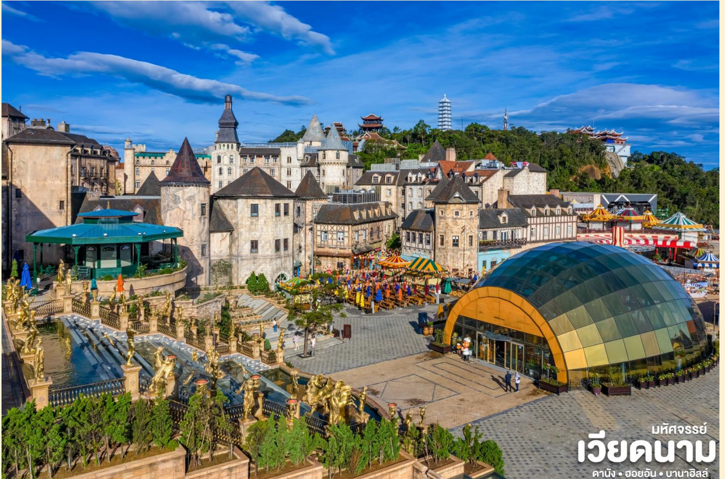
มัททววรรษย์ เวียดนาม ดานัง • ฮอยอัน • บานาฮิลล์

นำท่านชม สะพานสีทอง สถานที่ท่องเที่ยวใหม่ล่าสุดตั้งโดดเด่นเป็นเอกลักษณ์อย่างสวยงาม บนเขาบานาฮิลล์ นำท่านสู่จุดที่สร้างความตื่นตะลึงให้นักท่องเที่ยวมองดูอย่างอึ้งการที่ซึ่งเต็มไปด้วยเสน่ห์แห่งตำนานและจินตนาการของการผจญภัยที่ สวนสนุก The Fantasy Park (รวมค่าเครื่องเล่นบนสวนสนุก ยกเว้น หุ่นซีผึ้ง