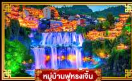
หมู่บ้านฟุรงเจิ้น