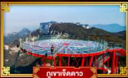
กุเงาเจ็ดดาว

“ฟุรงเจิ้น” อสังการหมู่บ้านโบราณริมน้ำตก