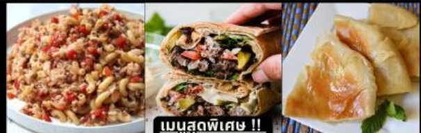
เมนูสุดพิเศษ !! KOSHARI (ข้าวคลุกถั่ว) / SHAWERMA (เนื้อห่อแป้ง) / FITEER BALADI (พิซซ่าอียิปต์)