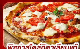
พิซซ่าสไตล์อิตาลีแบบแท้