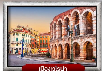
เมืองเวโรน่า

เมนู พิเศษ! สปาเก็ตตี้เส้นหมึกดำ, พิชซ่าสโตร์อิตาเลียนแท้