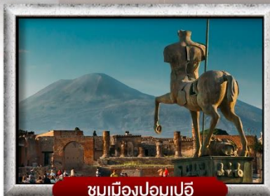
ชมเมืองปอมเปอี