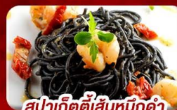
สปาเก็ตตี้เส้นหมึกดำ