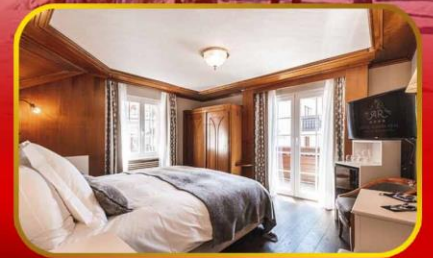
Exclusive การันตีพัก Boutique Hotel Albana Real Zermatt ทั้ง 2 พี่เรียด