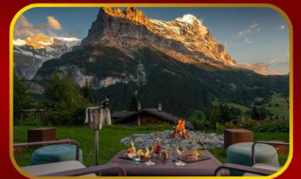
พี่เรียด 21-29 ต.ค. 67 พักโรงแรม Sunstar Alpine Hotel Grindelwald วิวอลังการแสนล้าน 2 คืนติด!!!