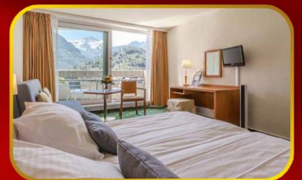
พี่เรียด 10-18 พ.ย. 67 พักโรงแรม Hotel Metropole Interlaken โรงแรมใจกลางเมืองแห่งขุนเขา 2 คืนติด

ไม่ต้องจ่ายเพิ่ม ไม่ต้องรอลุ้น การันตีชัวร์ๆ