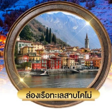
ล่องเรือทะเลสาบโคโม