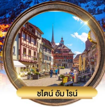
ชไตน์ อัม ไนน์