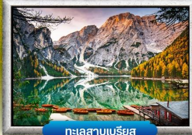
ทะเลสาบเบรียส