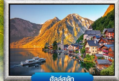
อัลส์สตีค