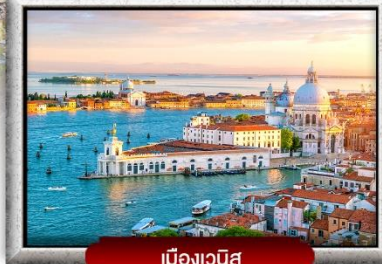
เมืองเวนิส

📍 ซอปปิง 4 เมือง ปารีส อินลาเก้น มิลาน โรม