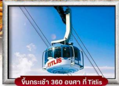
ขึ้นกระเช้า 360 องศา ที่ Titlis