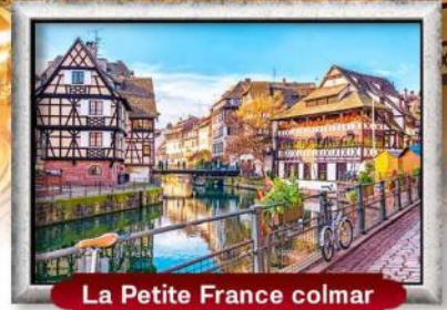
La Petite France colmar

บินหรู สายการบิน Full Service | พิเศษ! หอยแอสคาโก้