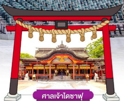
ศาลเจ้าโดซาฟุ