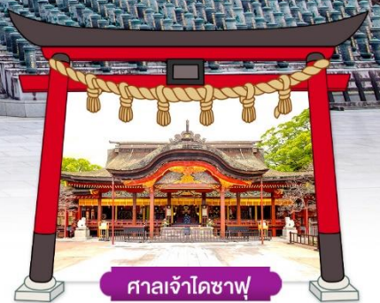
ศาลเจ้าโดซาฟุ