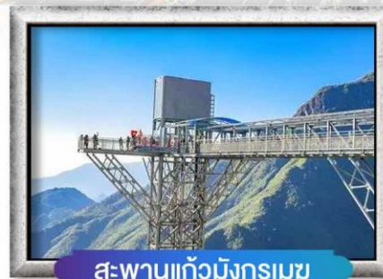
สะพานแก้วมิงกรเมซ