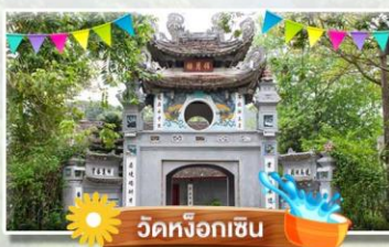
วัดหิ่งกเฮิน