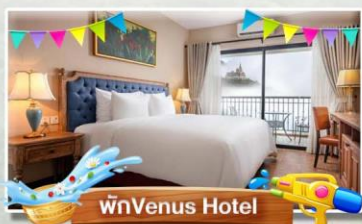
พนัก Venus Hotel

VENUS HOTEL 4* หรือเทียบเท่ามาตรฐานเวียดนาม