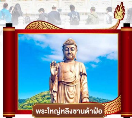
พระใหญ่หลังซานต้าผิง