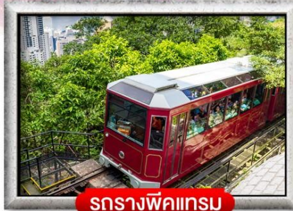
รถรางพิกแตรม