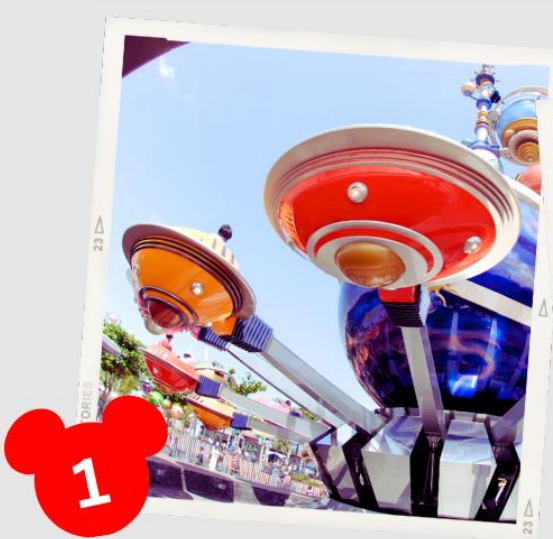
MAIN STREET USA