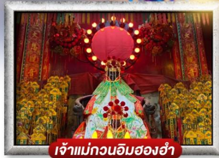
เจ้าแม่กวนอิมสองห้า