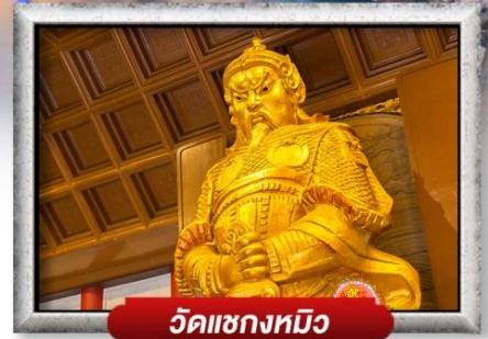
วัดเซ่งหิว