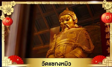
วัดแขกหมิว

หมูนกั้งหันนำโชควัดแขก ส่วนสนุกดิสนีย์แลนด์เต็มวัน