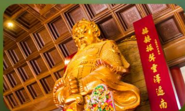
วัดแขกหมิว