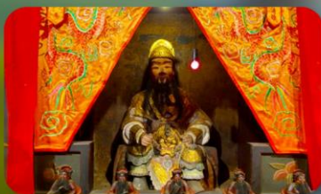
องค์แขกเก่า 600 ปี