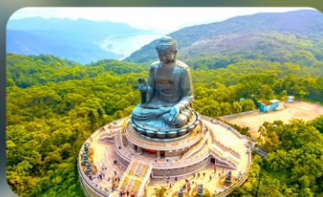
พระใหญ่นองปิง