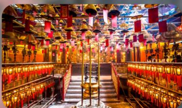
วัดหม่านโม