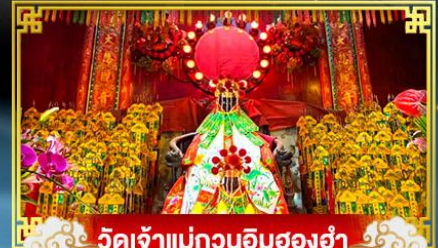
วัดเจ้าแม่กวนอิมสองฮ่า