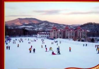
ลานสกียานูลี