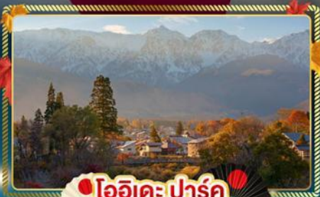
🍁 โออิชิออนเซ็น