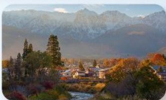
โออิเดะ ปาร์ค