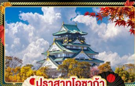
🍁 ปราสาทโอซาก้า