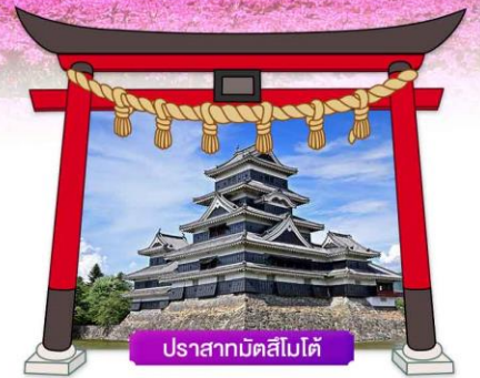
ปราสาทมัตสึโมโด้