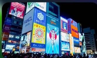
ซ้อปิ้งชินโซบาชิ