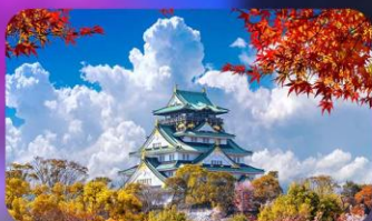
ปราสาทโอซาก้า