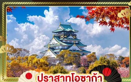
ปราสาทโอซาก้า