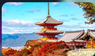
วัดคิโยมิจิ