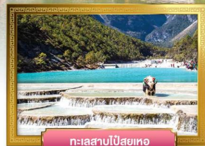
ทะเลสาบไป๋สฺยเหอ