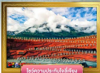
โซ่วความประทับใจลี่เจียง