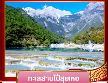
ทะเลสาบไป๋สุยเหอ