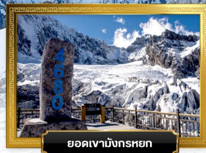
ยอดเขามังกรหยก