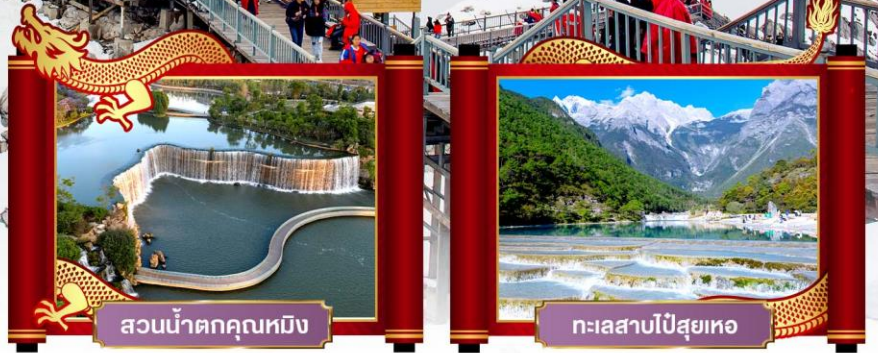
สวนน้ำตกคุณหมิง

พิเศษ! โชว์จางอวี๋ใหม่ "ความประทับใจลี่เจียง"