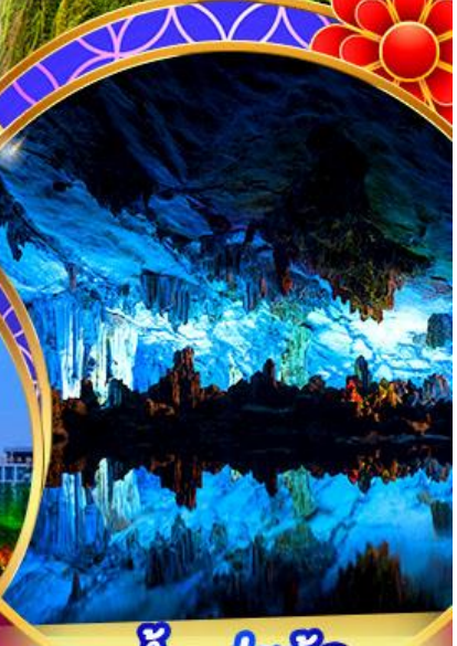
ถ้ำลุยอ้อ