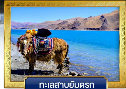
ทะเลสาบยัมดรก

เดินทางโดย: สายการบินลัคกี้แอร์ & ไซน่าอีสเทิร์นแอร์ไลน์