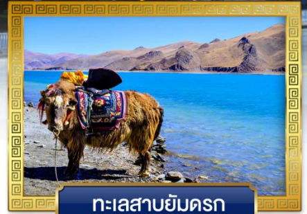
ทะเลสาบยัมดรก

เดินทางโดย: สายการบินลัคกี้แอร์ & ไซน่าอีสเทิร์นแอร์ไลน์