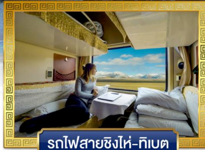
รถไฟสายชิงไห่-ทิเบต