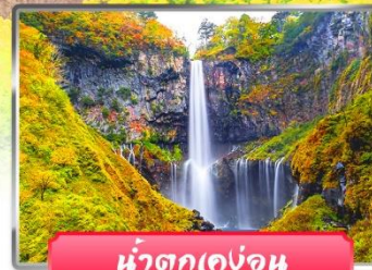
น้ำตกเคงอน