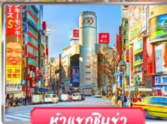
หน้าแจกชิบูย่า