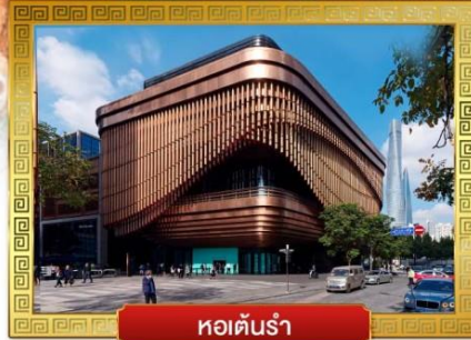
หอตันร่า

☑️ เดอะบันด์ .. เยือนถิ่นเจ้าพ่อเซี่ยงไฮ้