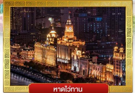
หาดไว่กาน