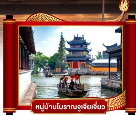
หมู่บ้านโบราณจูเจียเจี๋ย