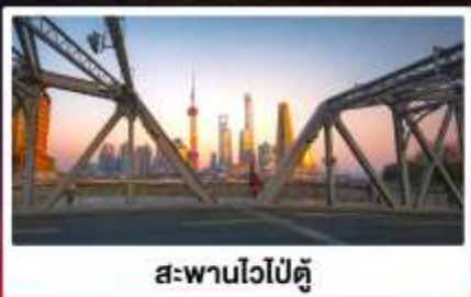
สะพานไวป๋อดู่