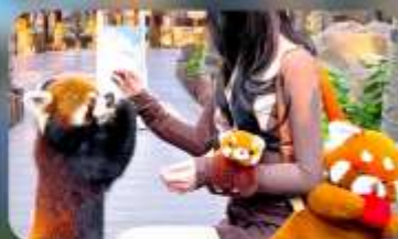
ให้อาหารแพนด้าแดง