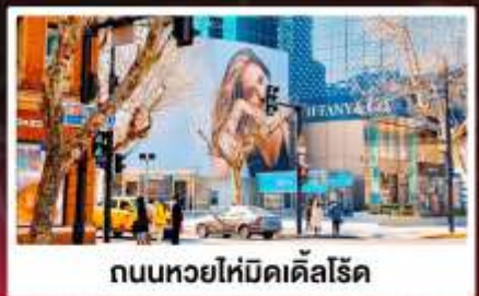
ถนนหวยไห่มีดเคิลโรด