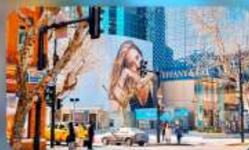
ถนนทวยไห่มีดเคิลโรด