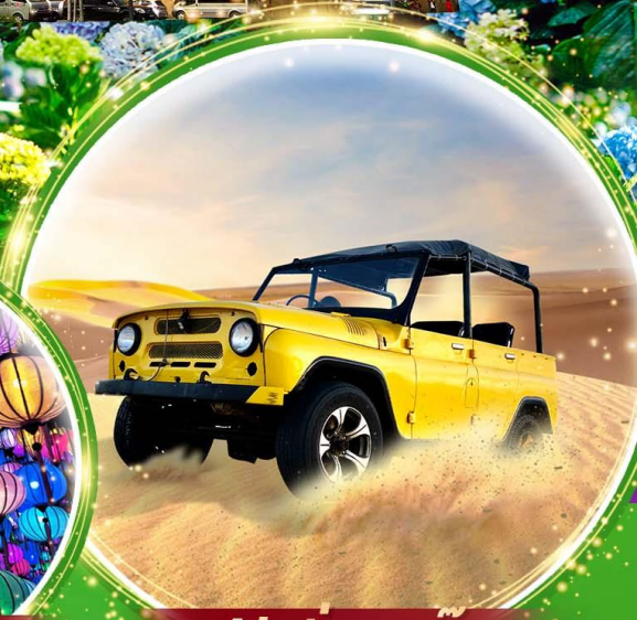
ฟรี! นั่งรถจี๊ป