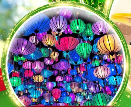
สวนแห่งแสง (Lumiere Light Garden)