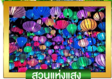
สวนแห่งแสง