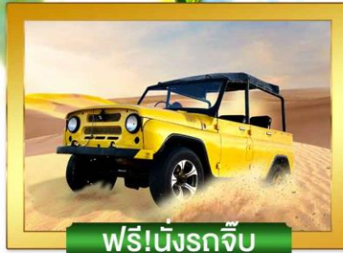
ฟรี!นั่งรถจี๊ป