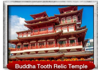
Buddha Tooth Relic Temple