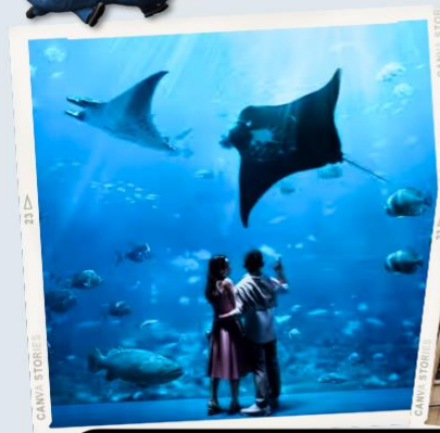
ZONE 7 : FAR FAR AWAY