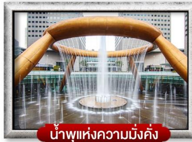
น้ำพุแห่งความมั่งคั่ง