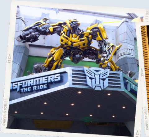
ZONE 1 : HOLLYWOOD