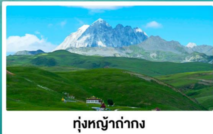
ทุ่งหญ้าท่ามกลาง