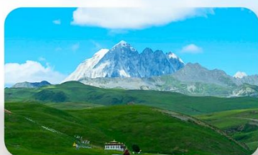
ทุ่งหญ้าด่าง