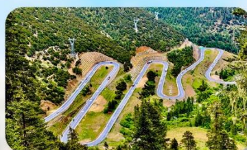
ถนน 18 โค้ง