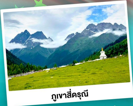
ภูเขาสิ่ดรุณี