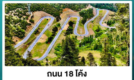
ถนน 18 โค้ง